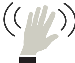
Technologie zonder aanraking