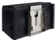
Montagekit voor DIN-rail voor 14M