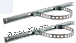
2 Paal bevestigingskit LCWU-600POST