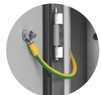
6 LCWU-160EW Aardingskabel 6mm 2 /160mm