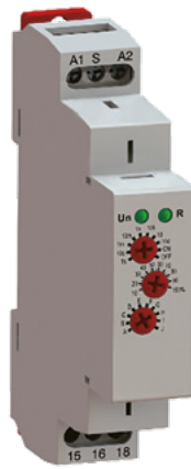
➤ LCTRD55U (multi-programma)