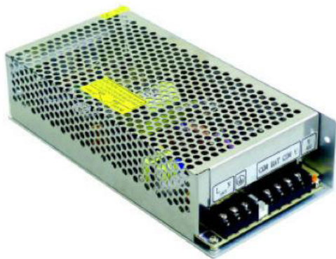
➤ LCHF100 / 155